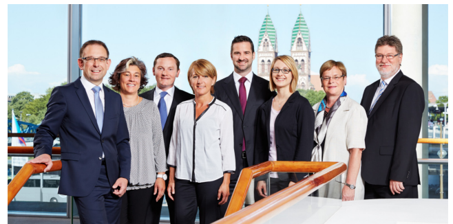
Das Team der Freiburger Vermögensmanagement GmbH (FVM)