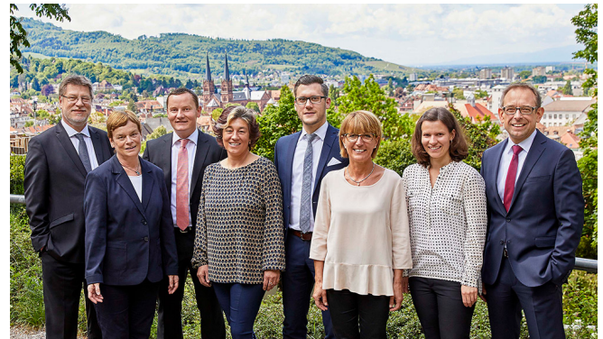
Das Team der Freiburger Vermögensmanagement GmbH (FVM)