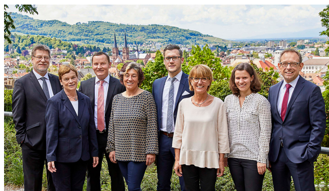
Das Team der Freiburger Vermögensmanagement GmbH (FVM)