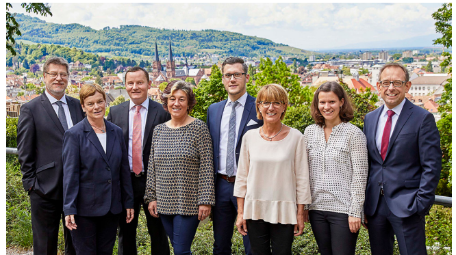
Das Team der Freiburger Vermögensmanagement GmbH (FVM)