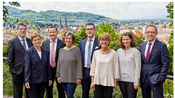
Das Team der Freiburger Vermögensmanagement GmbH (FVM)