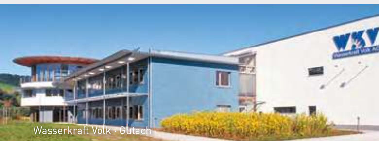
Wasserkraft Votk · Gutach