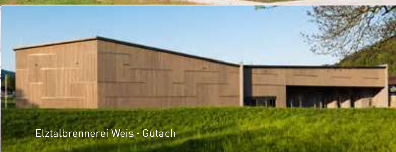
Elztalbrennerei Weis · Gutach